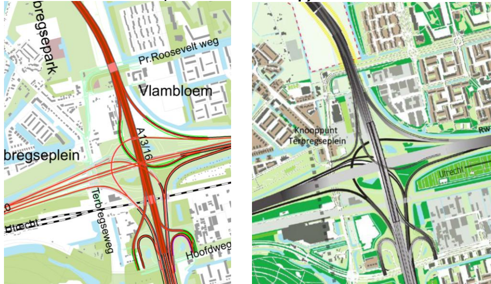
Afbeelding 3.2. Aansluiting A13/A16 op OWN Terbregseplein (links MER variant, rechts OTB ontwerp)

De gemeente Rotterdam had als wens om al het verkeer via de Hoofdweg te ontsluiten (conform MER-variant 2). Bij MER-variant 2 is de volledige aansluiting op de Hoofdweg vormgegeven als een half klaverblad. Doordat nu, in tegenstelling tot variant 2, uitgegaan wordt van een bovenlangse passage van het Terbregse Plein, bleek het niet mogelijk een wegontwerp te maken waarbij een volledige aansluiting op de Hoofdweg werd ingepast. In het OTB ontwerp is daarom gekozen voor een driekwart 16 aansluiting op de Hoofdweg en een kwart 17 aansluiting op de Terbregseweg. De aansluiting op het OWN kan daarmee gezien worden als een combinatie van MER-variant 2 en MER-varianten 4 en 7 (zie afbeelding 3.3) welke ook een aansluiting op de Terbregseweg hebben.