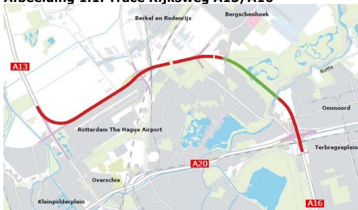
Afbeelding 1.1. Tracé Rijksweg A13/A16

In de Trajectnota/MER zijn de mogelijke alternatieven en varianten voor het beoogde tracé en de effecten daarvan nader uitgewerkt. Een zestal tracévarianten is uitgewerkt en onderling vergeleken. Deze Trajectnota/MER is in augustus 2009 gepubliceerd en ter inzage gelegd. De Commissie MER heeft deze getoetst en een positief advies gegeven.