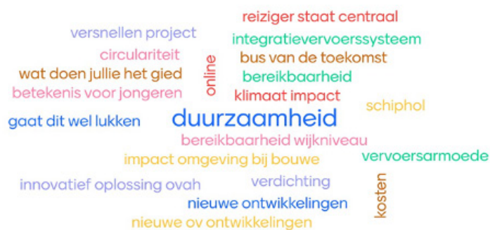
Figuur 3, uitkomsten Mentimeter

Wat zou een goed thema zijn voor een volgende talkshow over OVAH?