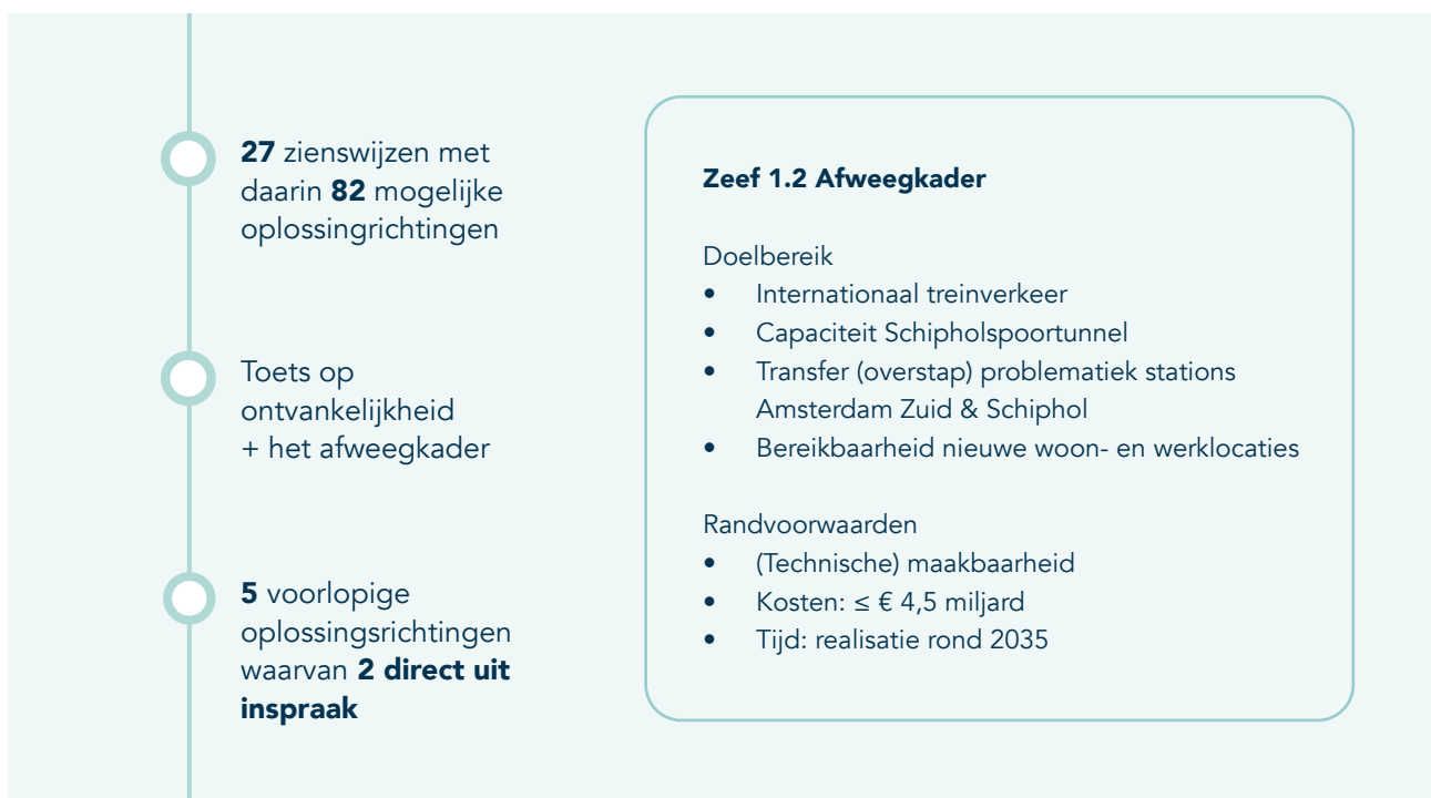
Figuur 1, schematisch overzicht toetsing zienswijzen

Met enkele indieners zijn gesprekken gevoerd zodat zij hun zienswijze verder konden toelichten. Dit alles heeft geleid tot vijf (deels nieuwe) voorlopige kansrijke oplossingsrichtingen en een aantal kansen. Denk bijvoorbeeld aan de suggestie om een extra halte bij Badhoevedorp toe te voegen; dit wordt meegenomen in de volgende fase van de verkenning. Alle indieners ontvangen een antwoord op de door hen ingestuurde zienswijze. Deze wordt gegeven in de Nota van Beantwoording (NvB) die in het eerste kwartaal van 2025 wordt gepubliceerd op ovamsterdamhaarlemmermeer.nl en wordt toegestuurd naar de indieners van een zienswijze.