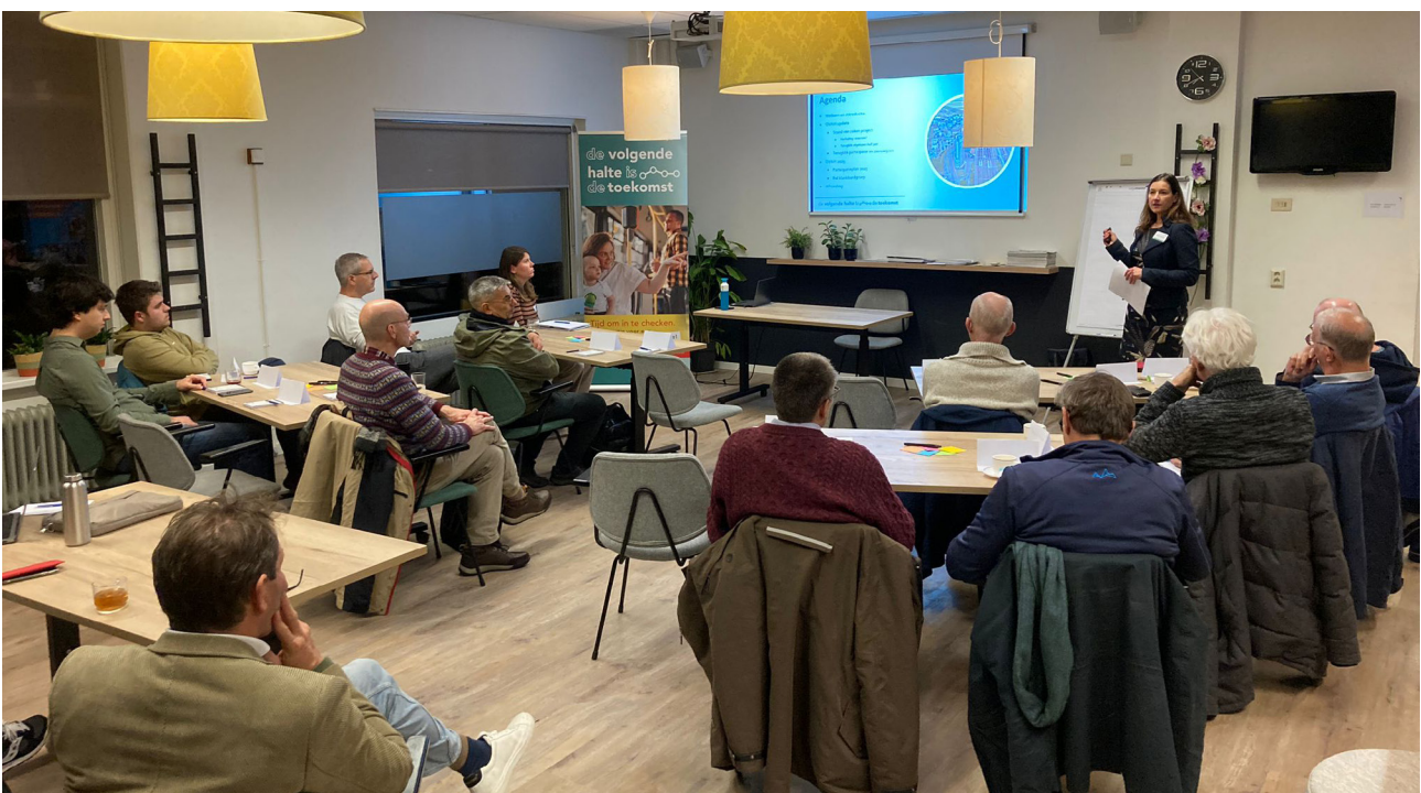
Bijeenkomst in Hoofddorp, 21 november 2024

Tijdens het tweede gedeelte van de bijeenkomst is stilgestaan bij de participatie in de volgende fase. Een aantal mensen gaf aan niet op voorhand actief in een klankbordgroep te willen plaatsnemen, maar wel graag op de hoogte te willen blijven. Er werd ook geopperd om mensen met een mobiliteitsbeperking en jongeren niet te vergeten in het vervolgtraject. Op dit moment wordt de vorm van de klankbordgroep en de precieze vorm van de participatie in de volgende fase uitgewerkt in het participatie-uitvoeringsplan voor de beoordelingsfase.