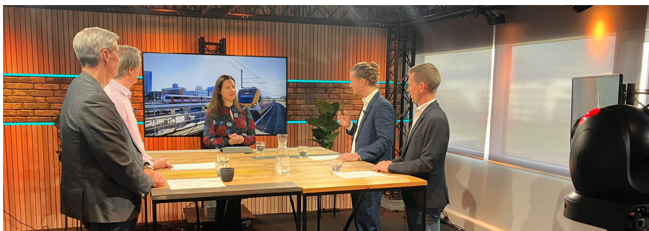
Talkshow OVER OVAH, 3 december 2024