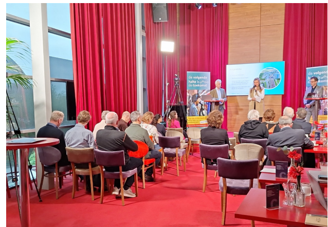
Informatiebijeenkomst in Hoofddorp, 11 april 2024