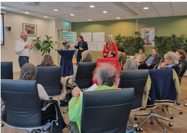
Informatiebijeenkomst in Amsterdam Zuid, 9 april 2024

De bijeenkomst van donderdag 11 april 2024 in Hoofddorp is terug te kijken via www.ovamsterdamhaarlemmermeer.nl/informatiebijeenkomsten .