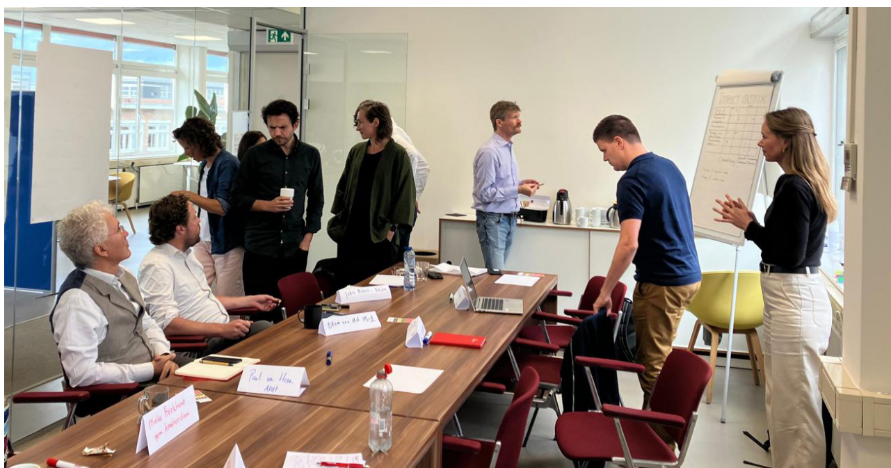
Werksessie Duurzaamheid van het projectteam, zomer 2024 te Amsterdam

De bestuurlijke opdrachtgevers van dit project zijn het Ministerie van Infrastructuur en Waterstaat (IenW), Vervoerregio Amsterdam (VRA), gemeente Amsterdam, gemeente Haarlemmermeer, provincie Noord-Holland, Royal Schiphol Group (RSG), Nederlandse Spoorwegen (NS) en Schiphol Area Development Company (SADC). In de diverse overleggen binnen dit project worden de partijen vertegenwoordigd. In het Directeuren Overleg (DO) worden besluiten genomen. Ter voorbereiding op een DO vindt een Ambtelijke Coördinatie Overleg (ACO) plaats voor advies. De dagelijkse aansturing van het project is gedelegeerd naar de twee opdrachtgevers IenW en VRA.