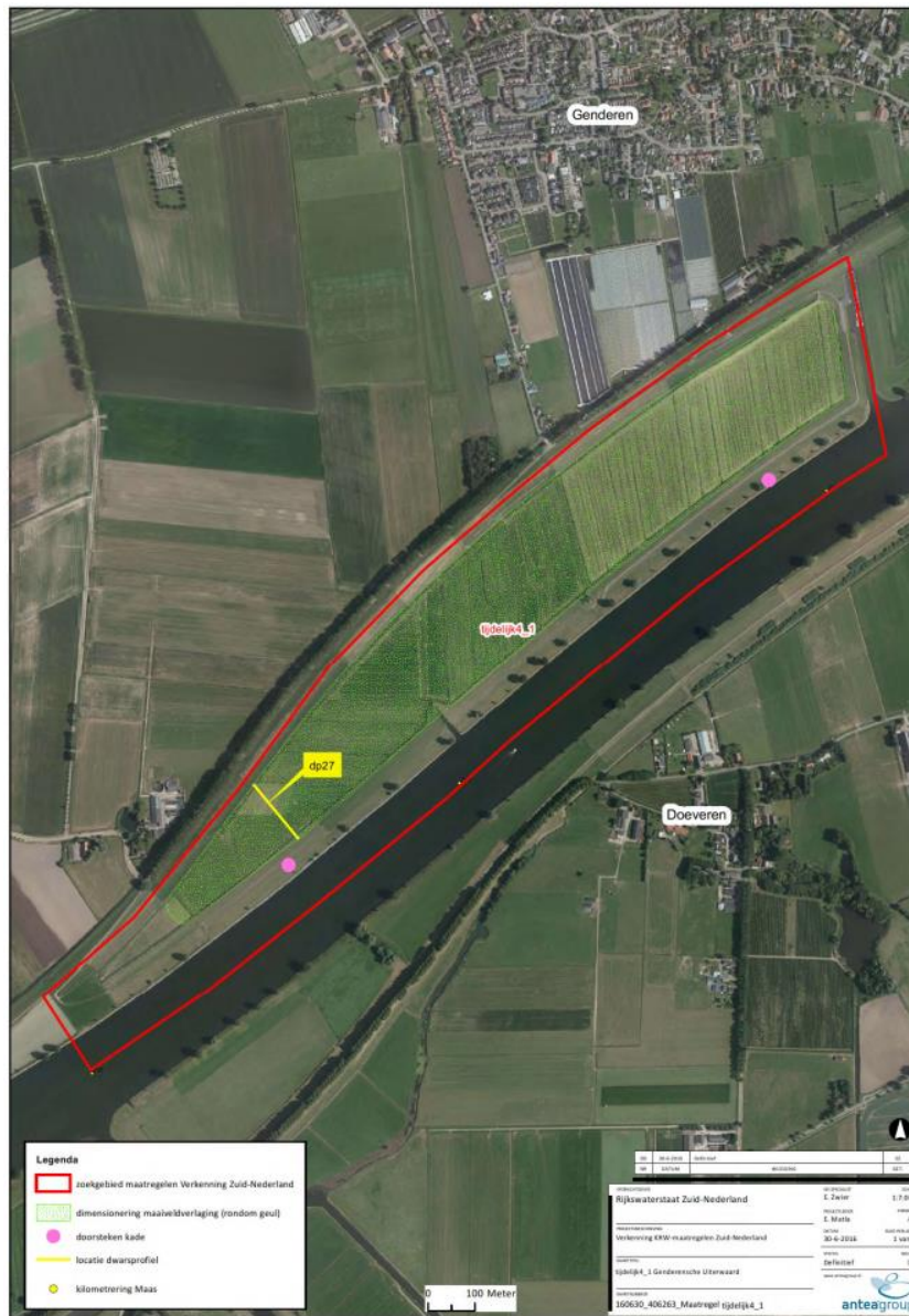
Figuur 5.1, Ligging zoeklocatie Genderensche Uiterwaard

Maatregel Genderensche uiterwaard bestaat uit het doorsteken in de kade en het reliëf verlagen van de uiterwaarden met ca. 1 meter tot het bereik van lagere waterstanden. Op twee locaties wordt de bestaande kade met ca 100 m verwijderd. Hierdoor ontwikkelen lage moerassige uiterwaarden met rietgorzen, wilgenstruwelen en structuurrijk grasland. Deze zijn inrunderend bij hoogwater en springtij en met de Maas verbonden via lage drempels en openingen in de kades.