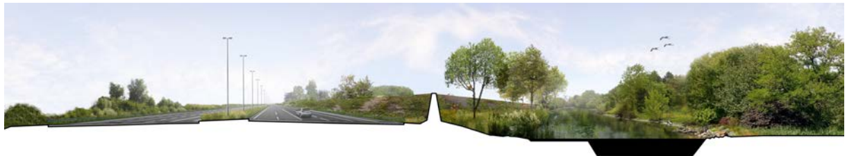
De A4 als ecologische ruggengraat voor groene en blauwe verbindingen in de regio.

Voor de verschillende deelgebieden wordt dit hoofdthema vervolgens nader gespecificeerd. Omdat het deel tussen Leidschendam en de Ketheltunnel al een stap verder is uitgewerkt dan het deel tussen Burgerveen en Leidschendam, is dit deel nader gespecificeerd in kleinere deelgebieden.