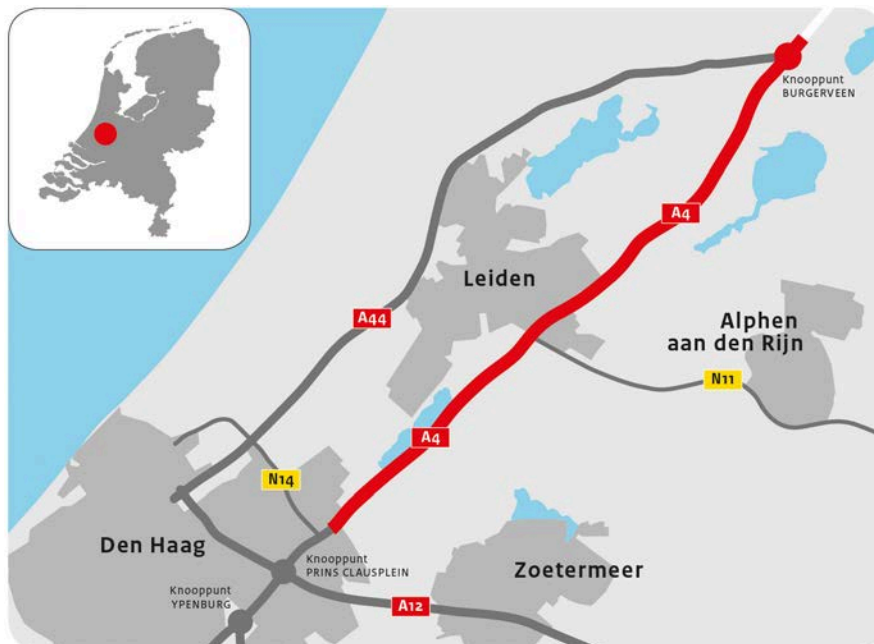
A4 Rijnland (Burgerveen - Leidschendam)

Het uitzicht op het water wordt versterkt, om de ligging van de weg in het laaggelegen polderlandschap te benadrukken. Historische waterstructuren worden zoveel mogelijk ontzien en waar dat niet mogelijk is, wordt deze met het karakter en in de geest van de bestaande structuur hersteld. Bij uitbreiding van wateroppervlak wordt deze uitgevoerd met natuurvriendelijke oevers.