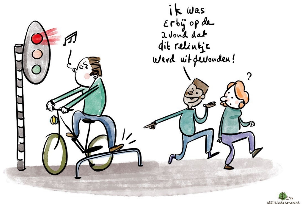
Cartoon impressie Fietscafe: "Ik was erbij toen dit railkje werd uitgedonden".

Zie bijlage B voor de ideeën die verder worden onderzocht.