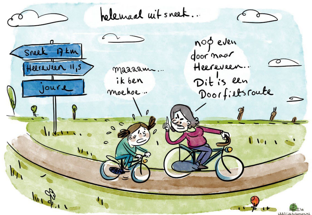
Cartoon impressie Fietscafé Joure: Doorfietsroute

Zie bijlage C voor de lijst ideeën die worden doorgegeven aan medeoverheden en partners.