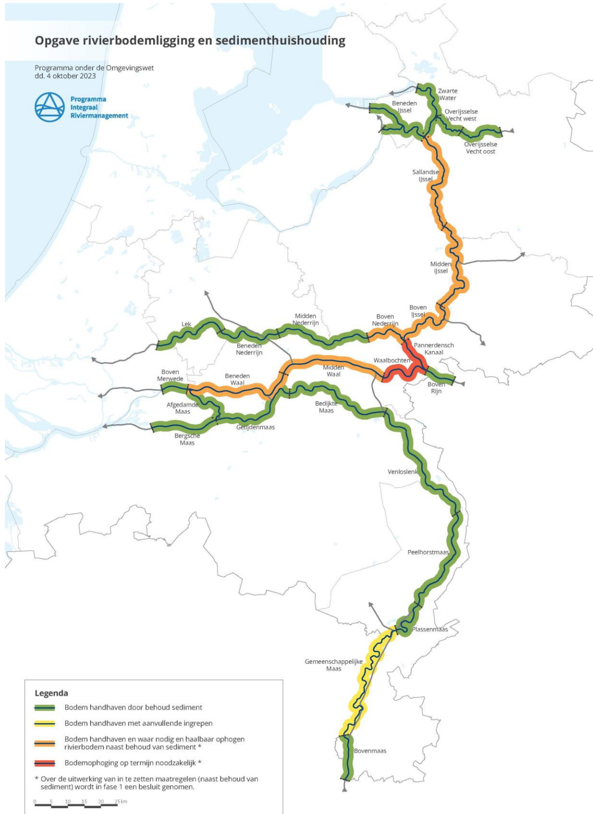
Abbildung S.3 Aufgabe Flussbettlage unter Berücksichtigung der aktuellen Situation (in der Karte in Absatz 8.3.2 ist die Veränderung gegenüber der Referenzsituation dargestellt)