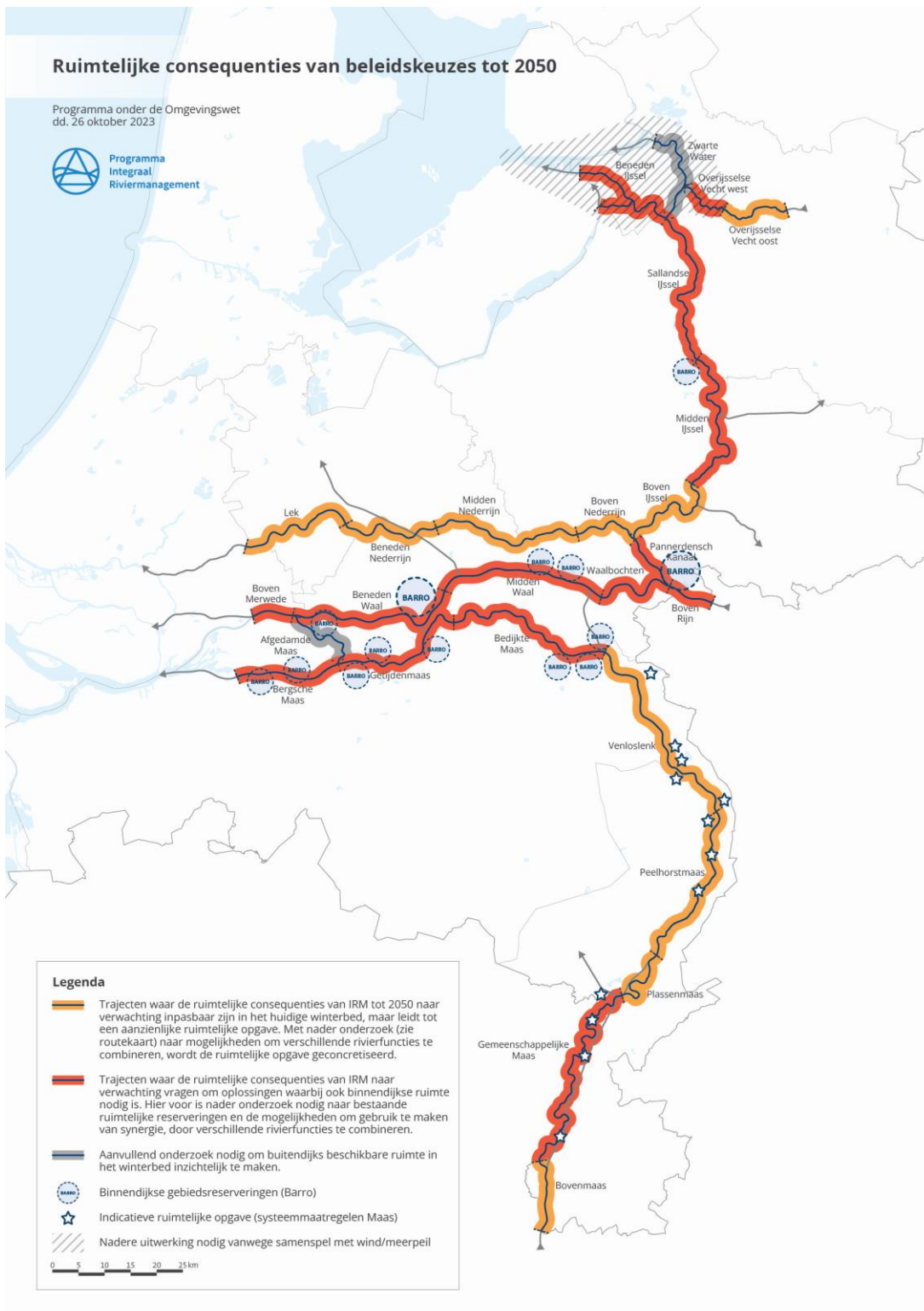
Abbildung S.5 Indikative räumliche Aufgabe 2050