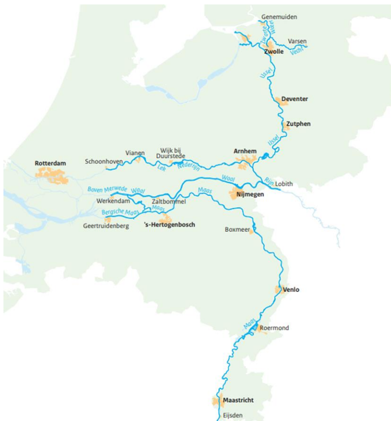
Abbildung S.1 IRM-Plangebiet

Im Zusammenhang mit dem IRM wurde diese Umweltverträglichkeitsprüfung (Plan-UVP) erstellt, in der die Auswirkungen politischer Entscheidungen im Rahmen des Programms untersucht wurden. Da erhebliche nachteilige Auswirkungen auf die Erhaltungsziele von Natura-2000-Gebieten nicht ausgeschlossen werden können, wurde zusätzlich auch eine Angemessene Beurteilung erstellt. Darüber hinaus wurde eine Kennziffern-Kosten-Nutzen-Analyse (KKNA) 1 erstellt.