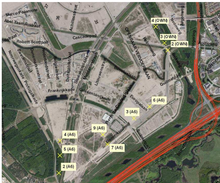
Bijlage 3a 'Almere Poort' en Bijlage 3b 'Almere Poort'

De vast te stellen hogere waarde op de gebouwen van het AMC te Amsterdam is in bijlage 3a aangegeven bij het adres 'Postbus 22660'. Daarbij komt de informatie in de tabel achter het postbusnummer overeen met de informatie bij het kruisje op het kaartje. Het punt bij het adres 'Postbus 22660 -AMC1a' ligt bij het kruisje met 'AMC1a'.