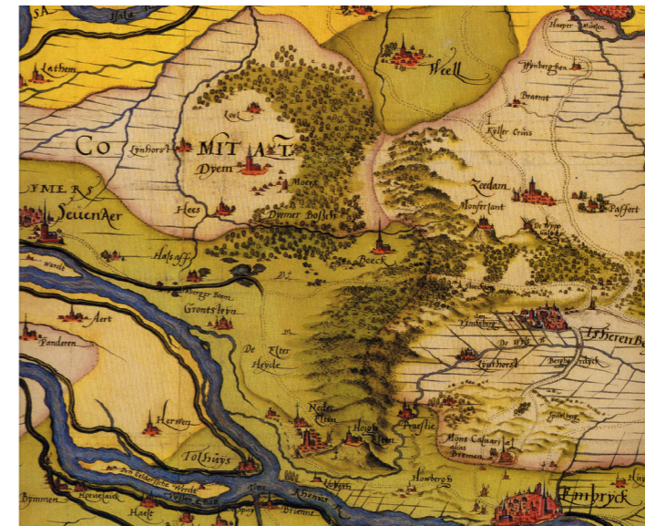
Historische kaart (1573) van Didam, Zeddam en omstreken met mooi zichtbaar de landschappelijke overgang van het rivierengebied rondom Zevenaer richting het zandlandschap rond Didam en Montferland.

Resumerend geldt dat het patroon van rivieren, uiterwaarden, oeverwallen en de overgangsruggen tussen de oeverwallen en stroomruggen, zandopduiking en stuwwal, nog altijd 'doorklinken' in de opbouw en ruimtelijke karakteristiek van het studiegebied in de Betuwe en Liemers. Dit vormt de basiskwaliteit van het gebied als 'ontvangend landschap' voor de doorgetrokken A15. Het nog goed leesbaar zijn van de structuur van het landschap is een 'kernkwaliteit' en vormt de basis van de landschappelijke inpassing voor de doorgetrokken A15. Bestaand landschapschoon wordt zoveel mogelijk ontzien of op zodanige wijze behandeld dat de aanwezige landschappelijke kwaliteiten juist vanaf de toekomstige rijksweg (blijvend) kunnen worden beleefd/ervaren.